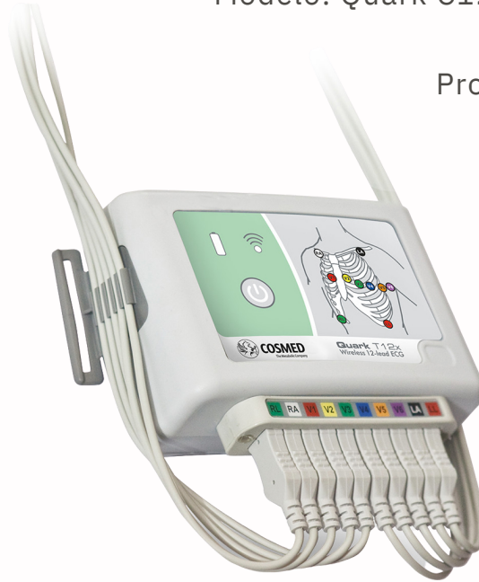
QUARK T12X Configuración por Telemetría