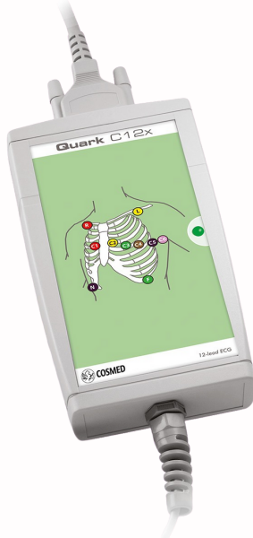
QUARK C12X Configuración por cable