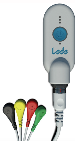
ECG Streamer (950920)