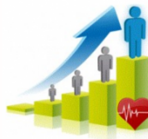
Licencia adicional LCRM (950906)